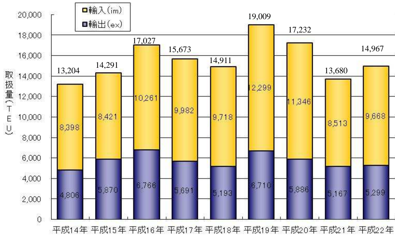
○曆年毎取扱貨物量(実入切)