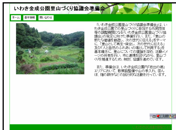
いわき市民活動情報サイト

また、18 年度末の対象団体以外にも対象を広げる方向で検討を進めることとなりました。