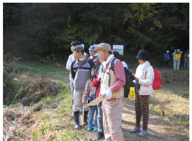
里山懇談会の様子(平成17年)