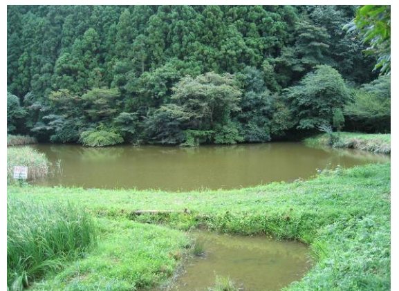
岩出の郷フト入ため池の様子

人は、平等に年を取り、時は等しく流れていく。自然も時間とともに姿を変えていきます。人と自然は、その中で「里山」という豊かな環境を創り上げました。その里山を守り、未来に伝えるミッションが私たちには与えられました。今やっている小さいことは、やがて大きく花開く。そう信じて、楽しく活動していきましょう。