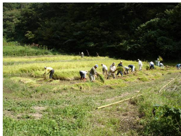
稲刈りの様子(平成17年)