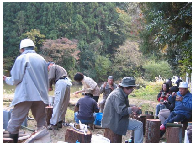
里山懇談会の様子(平成17年)