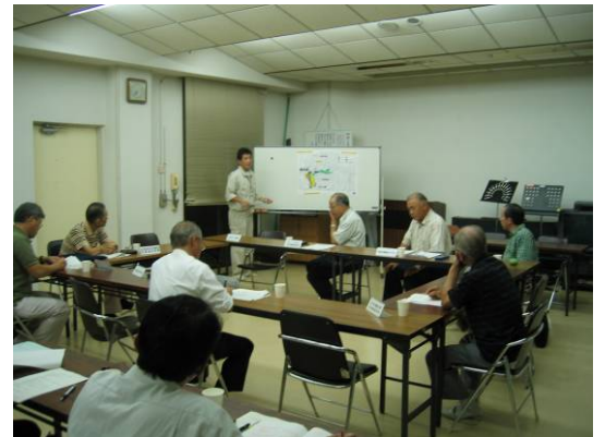
第7回準備会の様子