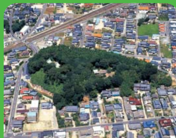
●樹林No1 シイ・カシ林 ●所在地 平下神谷字宿183(花園神社) ●樹林面積 3,200㎡ ●昭和53年3月10日 指定