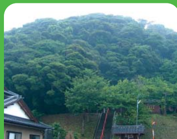
●樹林No3 シイ林 ●所在地 平豊間字八幡町(八幡神社) ●樹林面積 2,000㎡ ●昭和53年3月10日 指定