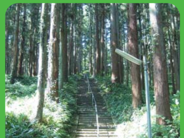
●樹林No11 スギ林 ●所在地 高倉町鶴巻(高蔵寺) ●樹林面積 3,000㎡ ●昭和55年9月1日 指定