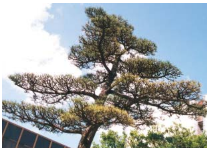
くろまつ（昭和46年10月1日制定）

当地方の気候、風土は松の育ちに適しており、「いわき七浜」の白砂青松の景勝と陸前浜街道の松並木はひろく知られています。松は百木の長といわれ成長力が強く、造園の核となるものとして欠かせず、本市の発展を象徴しています。