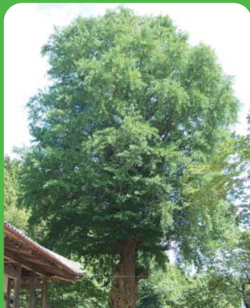
●No43 イチョウ ●所在地 三和町合戸字内畑(光福寺) ●樹高23.3m 幹回4.4m ●昭和54年3月31日 指定