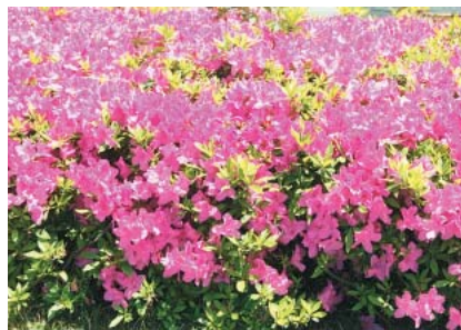
つつじ（昭和48年3月20日制定）

当地方の気候、風土は松の育ちに適しており、「いわき七浜」の白砂青松の景勝と陸前浜街道の松並木はひろく知られています。松は百木の長といわれ成長力が強く、造園の核となるものとして欠かせず、本市の発展を象徴しています。