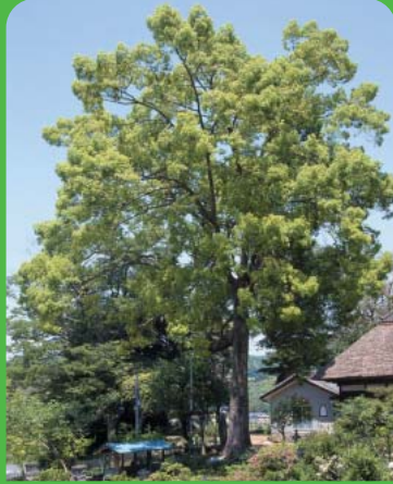
●No15 クスノキ ●所在地 平小泉字東164(瑞光寺) ●樹高24.7m 幹回2.7m ●昭和53年3月10日 指定

良好な自然環境や都市の美観風致を維持し、潤いのある市民生活を確保するために、古木・巨木・名木を所有者の同意をいただき、「保存樹木・保存樹林」として指定し、貴重な緑を後世に引き継ぎます。