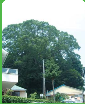
●No26 ケヤキ ●所在地 植田町八幡台(八幡神社) ●樹高30.0m 幹回3.7m ●昭和53年3月10日 指定