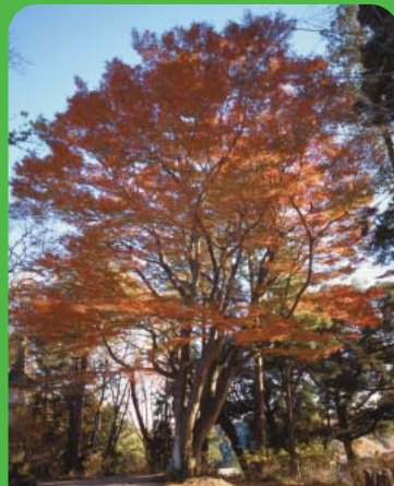
●No54 イロハカエデ ●所在地 常磐藤原町田場坂125(法海寺) ●樹高25.0m 幹回2.9m ●昭和54年3月31日 指定