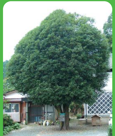
●No77 キンモクセイ ●所在地 川部町成作 ●樹高13.3m 幹回2.0m ●昭和55年9月1日 指定