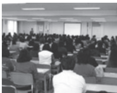
保護者を交えてのシンポジウム