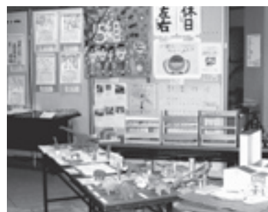
特別支援教育総合作品展の共催