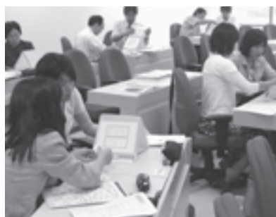
教員対象の専門研修