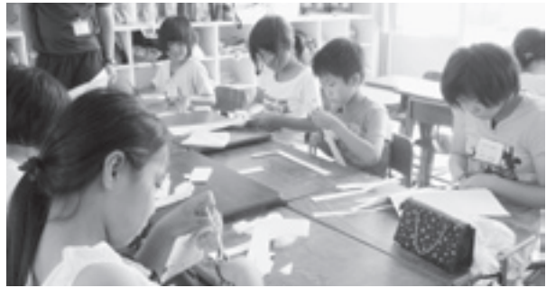
放課後子ども教室推進事業（23年度は御厩小で夏休み期間中に実施）

安全・安心な子どもの活動拠点（居場所）を設け、地域の方々の参画を得て、子どもたちと共に勉強やスポーツ・文化活動、地域住民との交流活動等の取組を実施しております。