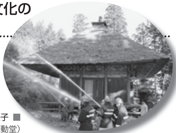
■ 第57回 文化財防火デーの様子 ■ (県指定重要文化財・満照寺不動堂)