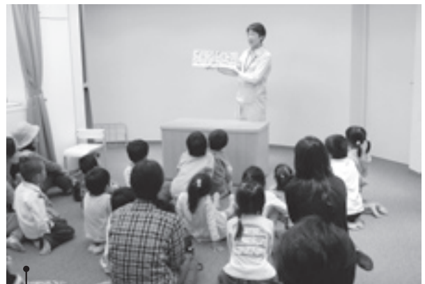
図書館事業 (図書館職員の読み聞かせ)

いわき総合図書館では、ボランティアによる定例のおはなし会や見学に来た子どもたちに読み聞かせを行うなど、子どもたちが本に親しむ機会を提供し、読書活動の推進に努めています。