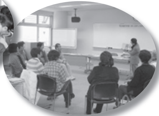
写真左： ■ 小学生と幼稚園児との交流の様子 ■ 写真右： ■ 子育てサポーター養成研修会 ■