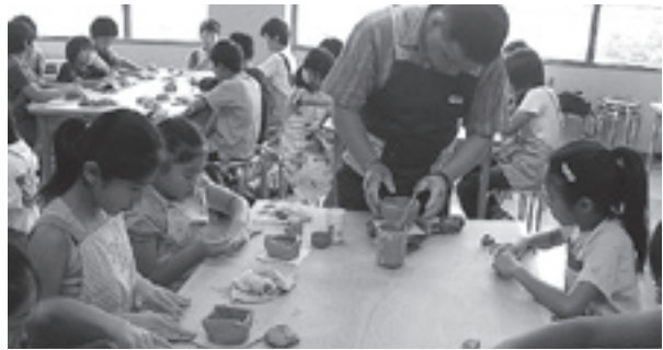
青少年を対象とした公民館事業（平ジュニアチャレンジ）

協調性や自主性を養うとともに、学校や学年の枠を越えた仲間づくりをねらいとして料理、工作、スポーツなどの体験学習を実施しています。