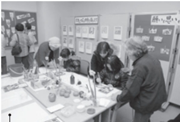
いわき市生涯学習プラザ (第7回生涯学習フェスティバル)

さらには、「いわき総合図書館」をはじめとする市内6図書館では、「第二期いわき市子ども読書活動推進計画」に基づく読書活動の推進や生涯学習時代にふさわしい多様な事業を展開するなど、生涯学習社会の形成と市民サービスの向上に努めていきます。